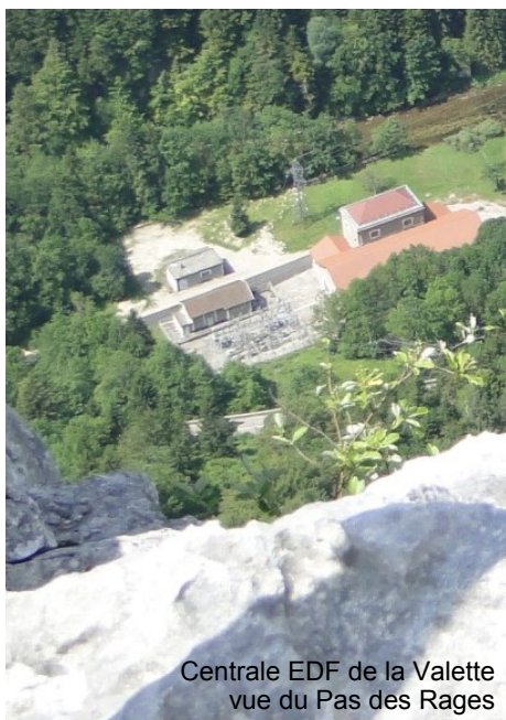
Centrale EDF de la Valette vue du Pas des Rages

Avec la FPU, à compter du 1er janvier 2014, la Communauté de communes percevra l'ensemble de la fiscalité professionnelle et reversera chaque année, à chaque commune, une attribution compensatrice d'un montant égal aux taxes professionnelles qu'elles ont perçues en 2013.