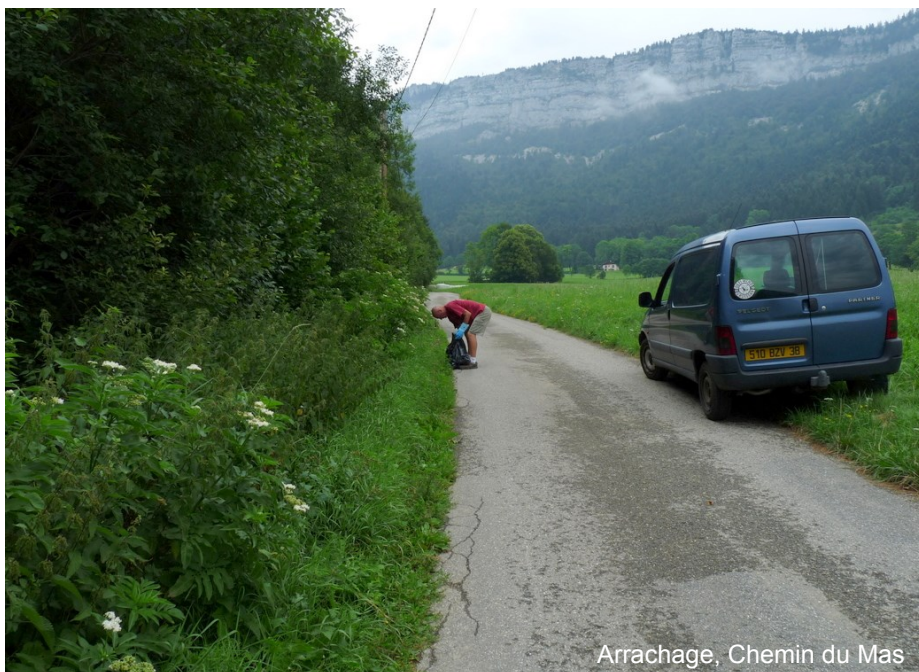
Arrachage, Chemin du Mas