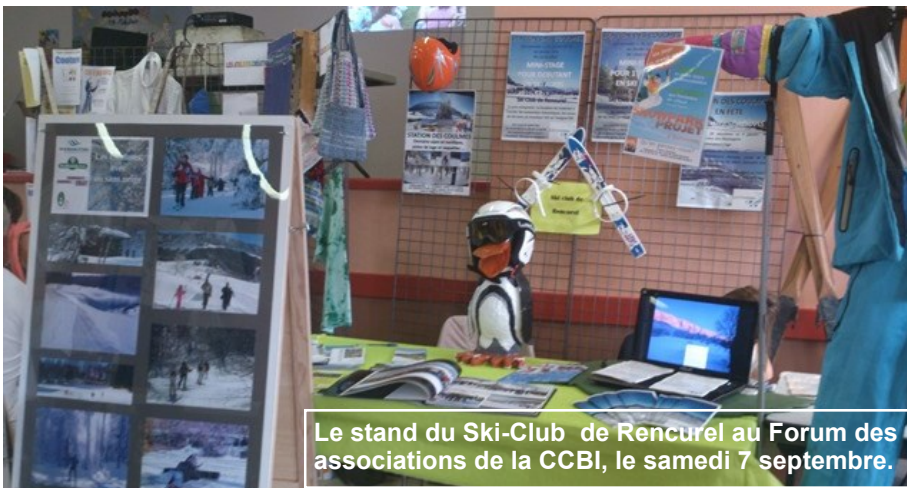
Le stand du Ski-Club de Rencurel au Forum des associations de la CCBI, le samedi 7 septembre.

Forum des associations de la CCBI à St Romans