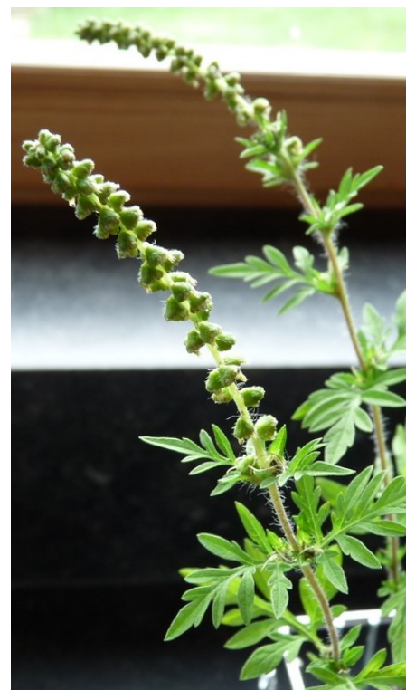
Plant d'ambrosie en fleurs

6 à 12% de la population française est sensible à l'ambrosie mais en Rhône-Alpes (Région très infestée), c'est 20% de la population qui est touchée.