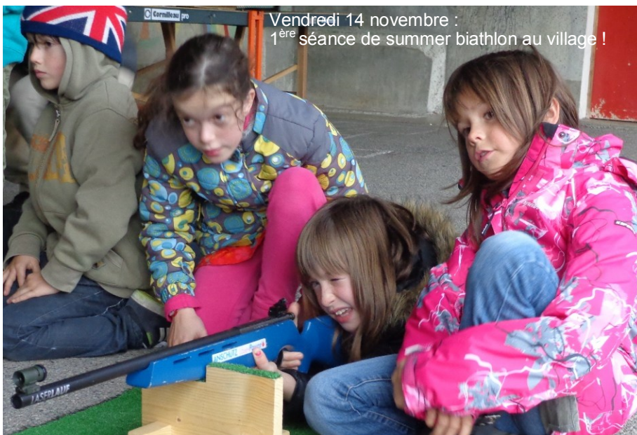
Vendredi 14 novembre : 1 ère séance de summer biathlon au village !