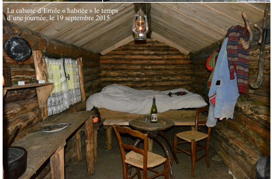
La cabane d'Emile « habitée » le temps d'une journée, le 19 septembre 2015