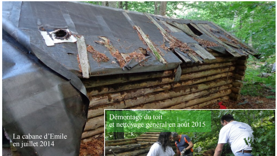
La cabane d'Emile en juillet 2014