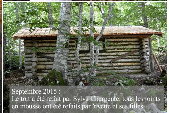
Septembre 2015 : Le toit a été refait par Sylva Charpente, tous les joints en mousse ont été refaits par Yvette et ses filles.